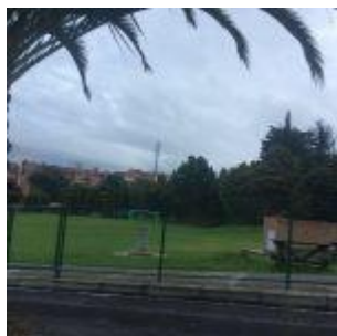
Colegio de Bogotá