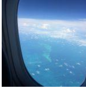
Desde el avión. Como se veía el mar cerca de Miami