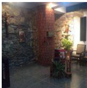
Capilla del colegio