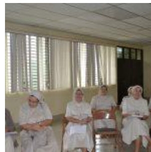
Reunión con Hermanas