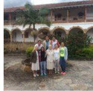
Grupo de postulantes