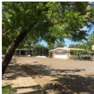
Colegio de la Providencia