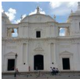
Catedral de León de Ncaragua