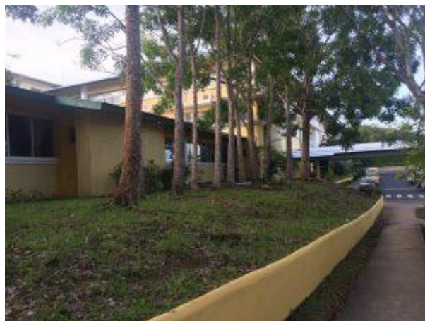
Parte de la fachada principal