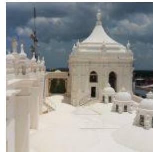
Catedral de León de Ncaragua