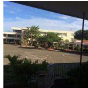
Colegio León carretera Poneloya