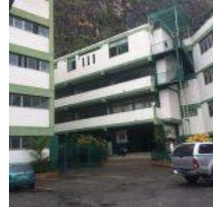
Colegio Fe y Alegría