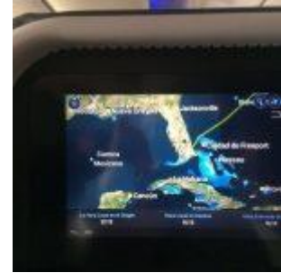
Llegando a Miami. Salida de Madrid a las 13:00. Llegada a Miami a las 16:30