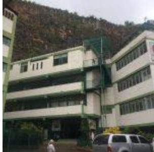
Colegio Fe y Alegría