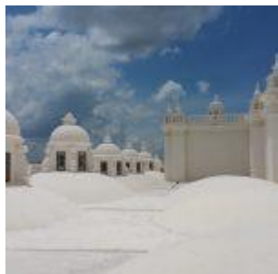
Catedral de León de Ncaragua