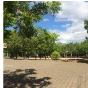
Colegio de la Providencia