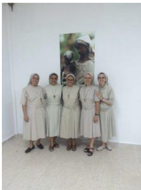
Hermanas del colegio de Panamá

Hoy me he dado cuenta que los dos botes que me dejaron en el baño, uno era champú y el otro crema corporal y yo creía que eran gel y champú. Con lo cual ayer me lavé la cabeza con crema corporal, yo notaba que el pelo me quedaba todo "pastoso", por más que lo aclaraba, y hoy igual. Hasta que he pensado: esto es imposible, y he mirado los nombres de los botes y ¡oh! por fin he sabido qué pasaba... Hay que ducharse con agua fría, porque que yo sepa no hay caliente, y confieso que tengo que llenarme de valor para el "chaparrón"... ¡Con lo buena que es el agua calentita!, pero va bien pasar por todo.