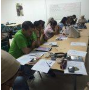
Grupo MFA en la oración final