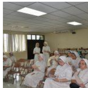
Reunión con Hermanas