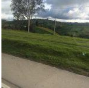
Camino al colegio de Bogotá