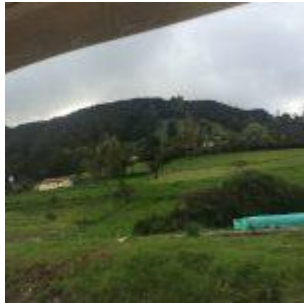
Camino al colegio de Bogotá