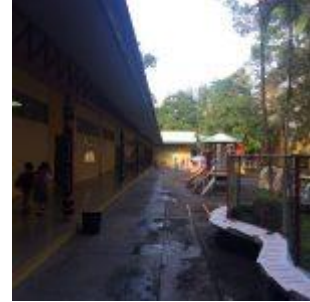
Zona de Infantil