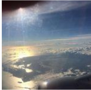
Salida de Miami a Panamá

Por fin, volando a Panamá. Las fotos desde el avión sobrevolando Miami eran maravillosas. Os incluyo alguna: