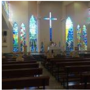
Capilla colegio Managua

Cuando me metí en la cama estaba bien cansada. Tanto que en un momento que encendí la luz vi en la pared techo de enfrente una lagartija algo considerable, en otra ocasión me hubiera levantado y le hubiera lanzado mis zapatillas o lo que tuviera hasta dejarla algo medio muerta, porque ya sé que tienen siete vidas, pero estaba tan atontada (el calor agota, abrumba, te deja "KO") que me dije: ¡pues que se pasee y mañana veremos!, cerré la luz y al día siguiente había desaparecido...En realidad, ni la vida, ni la muerte, ni las tormentas o terremotos, ni las lagartijas... pueden separarnos del amor de Dios porque estamos "en sus manos"