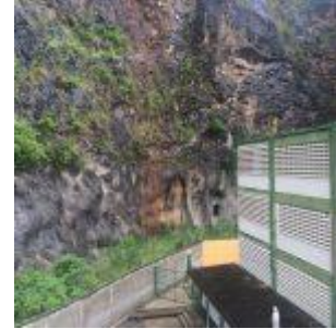
Colegio Fe y Alegría