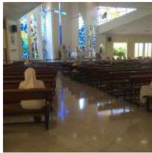
Capilla colegio Managua